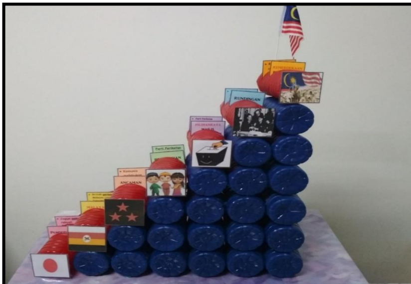
Rajah 3. Tangga Kemerdekaan

Langkah pelaksanaan aktiviti PdPc dengan menggunakan BBM Tangga Kemerdekaan ini adalah melibatkan tiga aktiviti, iaitu aktiviti Tangga Peristiwa, Tangga Memori dan Tangga Kata Kunci.